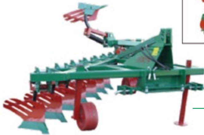
AFM-8 FP Plegado Hidr.

Ballestas de cinco hojas. Regulador de presión de ballestas. Enganche con barra oscilante. Rueda de control metálica (A partir de 8 cuerpos dos). Mayor despeje entre cuerpos. A partir de 6 cuerpos: cabezal desplazable.